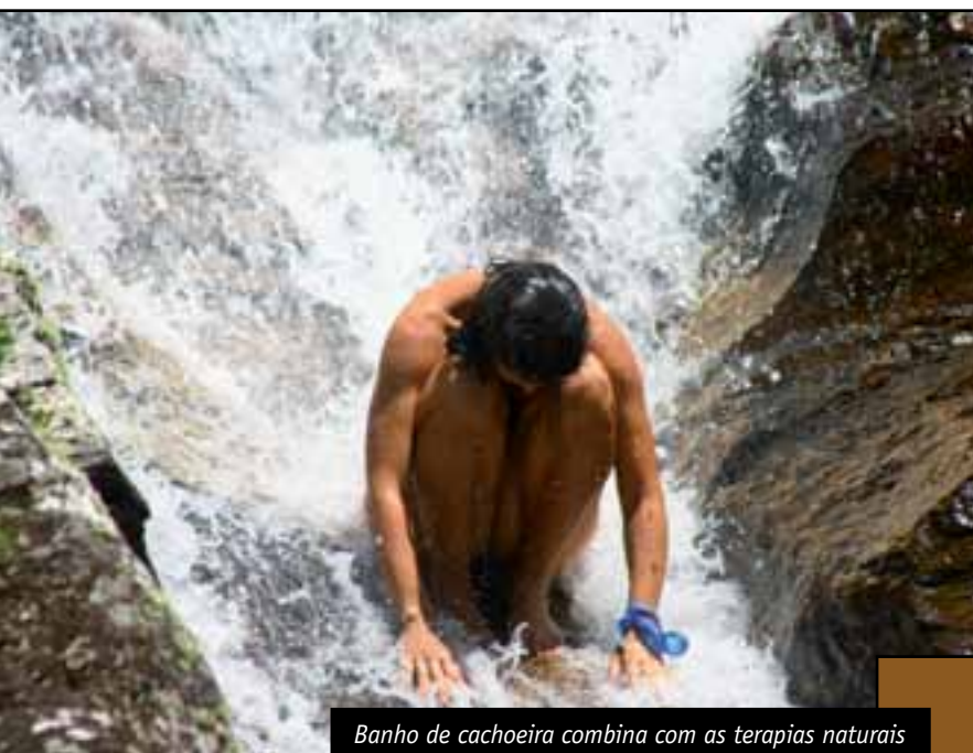
Banho de cachoeira combina com as terapias naturais