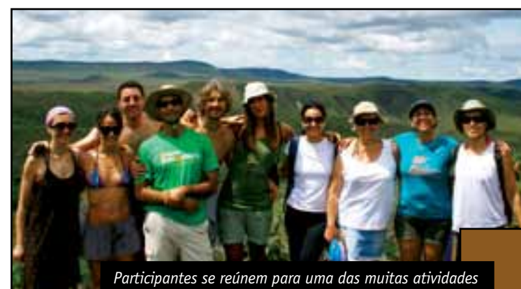
Participantes se reúnem para uma das muitas atividades

Comente esta matéria com o autor: faleconosco@viagensgerais.com.br