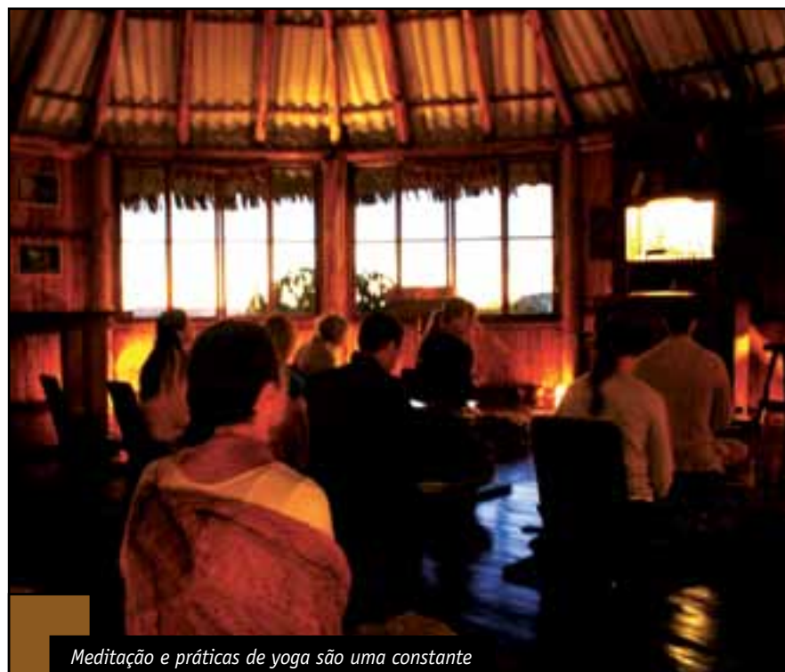
Meditação e práticas de yoga são uma constante

do deus Krishna. No Paraíso dos Pândavas, além dos retiros, funciona também uma ONG que desenvolve projetos sociais, como oficinas de alimentação natural e distribuição de alimentos orgânicos às crianças do sistema educacional de Alto Paraíso. A busca por um contato maior com temas espirituais e com nossa própria identidade vem se intensificando no mundo inteiro e, no Brasil, não é diferente. A tecnologia, ao invés de facilitar o cotidiano de cada um, deixou de tal maneira o mundo acelerado, que a vida das pessoas parece não lhes pertencer mais. O tempo, precisamente o elemento que a compõe, é como uma fera em constante enalço. Práticas como yoga e meditação