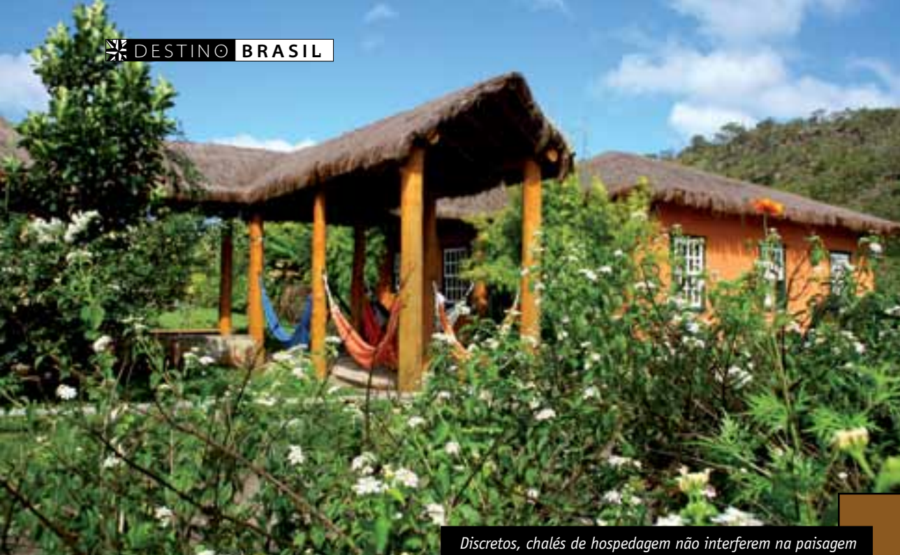
Discretos, chalés de hospedagem não interferem na paisagem

Krishna é chamada Prasadam, e essa energia e carinho especiais podem ser claramente percebidos nos alimentos preparados na fazenda. Como se poderia imaginar, os ingredientes são quase todos orgânicos, a maioria ali plantados e produzidos.