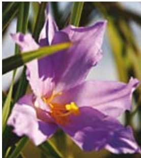
Natureza, caminhadas, alimentação ayurvédica e possibilidade de novas amizades